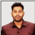
SRIKANTH SIR SCIENCE & TECHNOLOGY