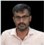
VINAYAK SIR ANCIENT & MEDIEVAL