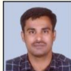
VINAYAK SIR HISTORY