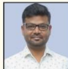
LINGARAJU SIR ESSAY