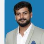
SANJAY SIR COMPUTER