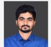
NANDAN SIR ENVIRONMENT & CA