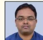
YOGANAND SIR AGRICULTURE