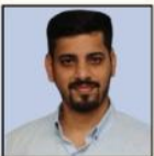
PRAJWAL SIR SOCIETY