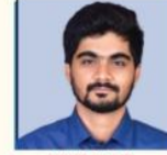
NANDAN SIR ENVIRONMENT & CA