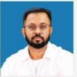
NAVEEN SIR MODERN & KARNATAKA HISTORY