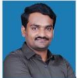
NINGAPPA MENTAL ABILITY