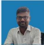
LINGARAJU SIR ESSAY, PRECIS & TRANSLATION