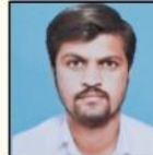
MANDAPUR SIR PHYSICS