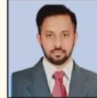
NAVEEN SIR HISTORY