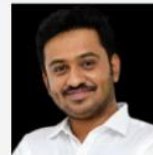
DHRUVA SIR WORLD INDIAN & KARNATAKA GEOGRAPHY