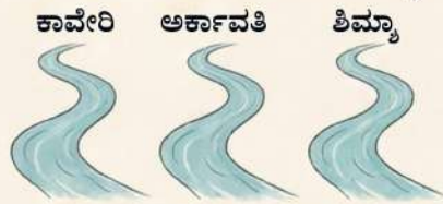
ಹಲವಾರು ಹೊಳೆಗಳ ಜೊತೆಗೆ.

ಈ ಅಭಯಾರಣ್ಯವು ಮೂರು ಪ್ರಮುಖ ನದಿಗಳಿಂದ ತುಂಬಿ ಹರಿಯುತ್ತದೆ: